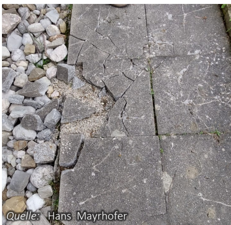
Gehwegplatten MZH: Mutwillig beschädigte Gehwegplatten bei der Mehrzweckhalle

Der Gemeinderat hat in seiner letzten Sitzung Anfang März einen Grundsatzbeschluss zur Sanierung bzw. Neubau der alten Trinkwasser-Leitung im Bereich der Kirchenstraße gefasst. Bis zur Gemeinderatssitzung Anfang Juni sollten entsprechende Kostenschätzungen und Planungsangebote vorliegen damit die Planung dann an ein Zivilingenieurbüro vergeben werden kann. Ziel ist die Umsetzung des Projektes im Jahr 2025.