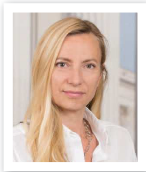
BM in Mag. a Dr. in Juliane Bogner-Strauß